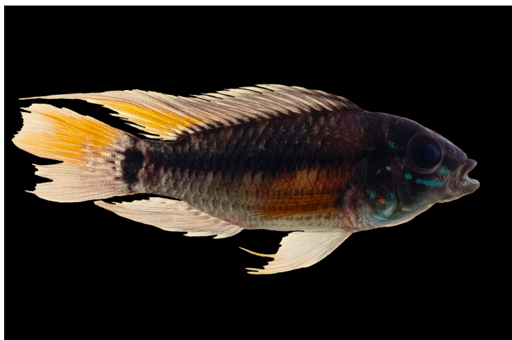
Figura 3. Apistogramma sp2 recolectada en el complejo lagunar Peregrinos, Solano, Caquetá, Colombia