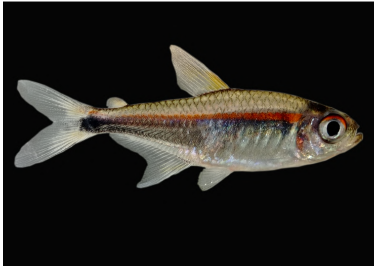
Figura 2. Hyphessobrycon sp1 recolectada en el complejo lagunar Peregrinos, Solano, Caquetá, Colombia

La mayor riqueza se registró en la laguna dos, con 70 especies (45,7 %), la laguna uno y el caño Isla Grande registraron la misma riqueza, con 45 especies, pero con diferencias en el número de individuos: 344 y 151, respectivamente. Los hábitats fluviales con el menor número de especies e individuos fueron la quebrada La Loma (6 y n=17), la quebrada La Polvorosa (11 y n=18) y caño uno (12 y n=65). En la quebrada La Loma se registró la mayor dominancia, representada por Hemigrammus sp2, y la mayor equitatividad, en la quebrada La Polvorosa (0,96).