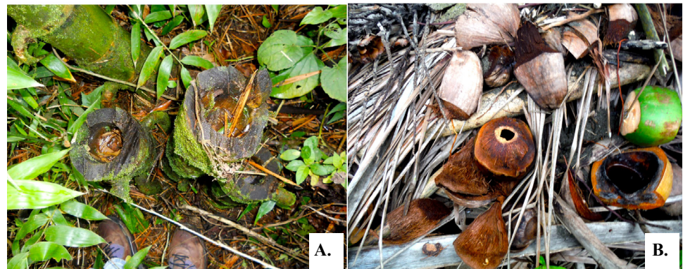
Figura 2. Criaderos de estados inmaduros de Trichoprosopon tipo fitotelmata: A) Guadual con criaderos naturales (tallos de guadua o tocones) en el eje cafetero (Antioquia). B) Residuos de cosecha de cultivo de coco en el municipio de Nuquí (Chocó)

Se resalta la presencia de Tr. digitatum ( Figura 1 ), especie reconocida como la de mayor importancia médica del género, altamente antropofílica y con actividad de picadura diurna. A pesar de que la tribu Sabethini ha sido relacionada con mosquitos selváticos y rurales, esta especie puede encontrarse habitando ambientes domésticos y peridomésticos ( Zavortink, et al., 1983 ). Otras especies como Tr. compressum y Tr. pallidiventer se han reportado colonizando neumáticos abandonados a la intemperie, lo que se ha considerado como un indicativo de plasticidad genética que, eventualmente, podría haber conducido a su domesticación ( Lopes, 1997 ). En el caso de Colombia, Tr. digitatum ha sido previamente observada en áreas periurbanas del departamento del Valle del Cauca (González, com. pers.). En el presente estudio se encontró en ambientes urbanos de los municipios de Sabaneta y Envigado. En el primer caso, en la zona verde de la Casa de la Cultura La Barquereña, con presencia de guaduales ( Figura 2 ), heliconias y vegetación riparia, donde la especie se asoció a los cortes de tallos de guadua (tocones de Guadua angustifolia ). En el segundo caso se encontró un adulto a menos de 20 metros de un guadual localizado en el jardín de una casa en un vecindario de la zona urbana del municipio de Envigado. Lo anterior confirma que este vector potencial de arbovirus está presente tanto en áreas rurales como en zonas urbanas de diferentes municipios de Colombia, asociada principalmente a