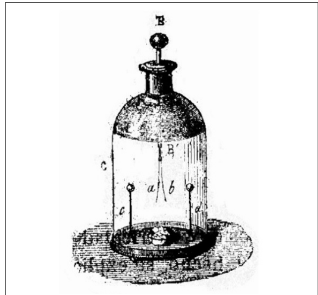
Figura 2. Electroscopio para determinar la naturaleza de la electricidad. Tomado de: http://www.librosmaravillosos.com/laelectricidadysusmaravillas/index.html

En nuestra investigación sobre rayos en la zona tropical hemos hecho campañas de medición multianual y hemos encontrado correlación con el fenómeno meteorológico de desplazamiento de la Zona de Confluencia Intertropical (ZCIT) (2002). Por ejemplo, en la figura 3 se presenta la variación multianual en la ciudad de Bogotá, Colombia, localizada en la región andina y la ciudad de la Habana, Cuba, localizada en la región Caribe. Mientras Bogotá presenta un comportamiento bimodal, en la Habana es monomodal, de acuerdo con el desplazamiento de la ZCIT. Interesante lograr una explicación del comportamiento de la actividad de rayos en función con el movimiento solar.