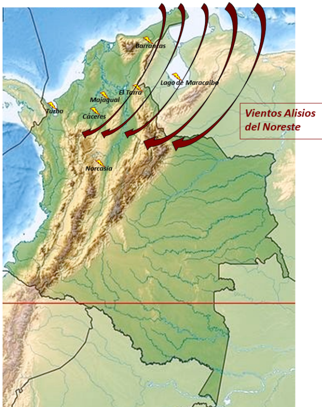
Figura 4. Actividad de rayos en la zona de Catatumbo (Elaboración propia)