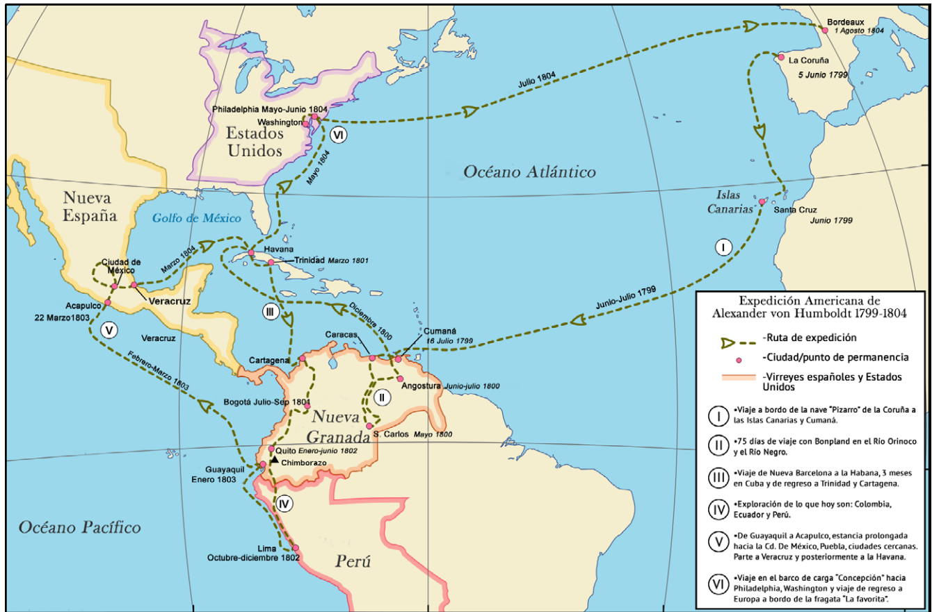
Figura 1. Itinerario de Humboldt en su viaje a la región tropical de América.

Faraday, Coulomb, Maxwell o Jean-Baptiste Boussingault, informador de Humboldt en sus expediciones en el ejército de Bolívar, descubridor de la fijación del nitrógeno en los suelos, fundamental para el entendimiento de la función de un rayo para formar óxidos de nitrógeno a partir del nitrógeno atmosférico y posteriormente nitratos.