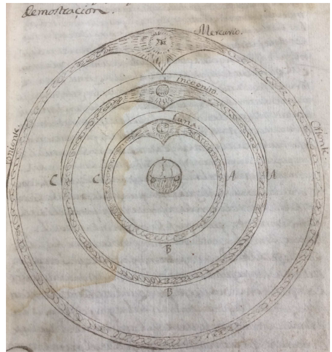
Figura 3: Imagen de la pág. 30 en la que muestra el cielo de la Luna, el cielo incógnito y el cielo del planeta Mercurio interactuando mutuamente a través de sus puntas piramidales

En el capítulo 5 Sánchez de Cozar explica con más detalle la forma geométrica que deben tener cada uno de los cielos. Como se explicará más adelante en la sección de análisis, para el autor tanto la “grosesa” (grosor) que ha de tener cada cielo como el peso de cada planeta y el ñudo que lo envuelve son fundamentales para efectos de que hayan perdido la estabilidad y cada uno posea una velocidad distinta de su movimiento. También introduce un auto reparo, en el que explica el porqué de su atrevimiento de sugerir que los cielos se mueven sin necesidad de requerir “inteligencias angélicas”.