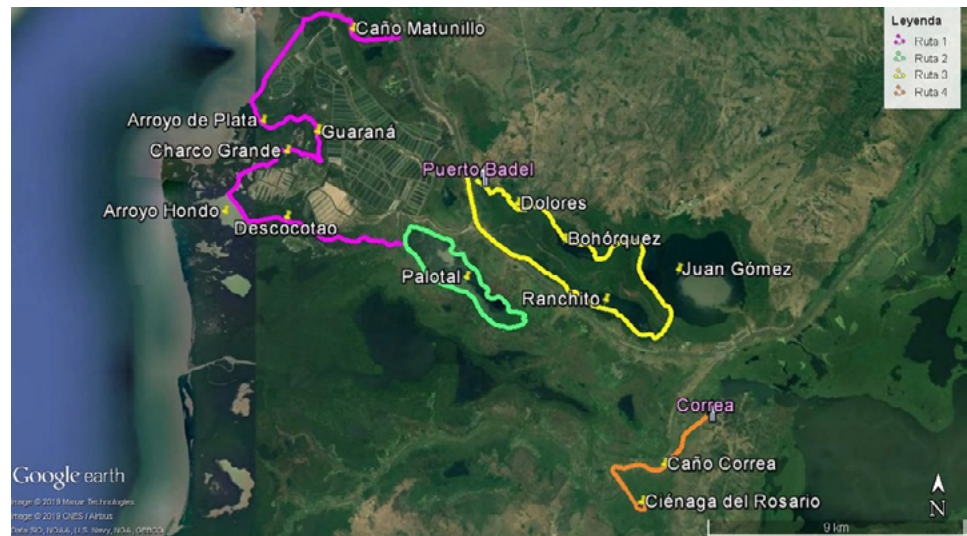
Figura 1. Rutas de muestreos

Ruta 2. (Inicio y final: 10^{\circ}5'13.61''N/75^{\circ}29'11.78''O ; 12,3 km recorridos). Incluyó la ciénaga de Palotal, cuya vegetación está conformada principalmente por pajonales distribuidos por toda la orilla y, en menor proporción, por eneales ( Typha dominguensis ), bijao ( Talia geniculata ), taruya o buchón de agua ( Eichhornia sp.), anón de agua ( Annona glabra ), cantagallo ( Erythrina fusca ) y oreja de ratón ( Salvinia auriculata ). En ella se desarrolla una importante actividad pesquera artesanal, especialmente de las comunidades de los corregimientos de Rocha y Puerto Badel.