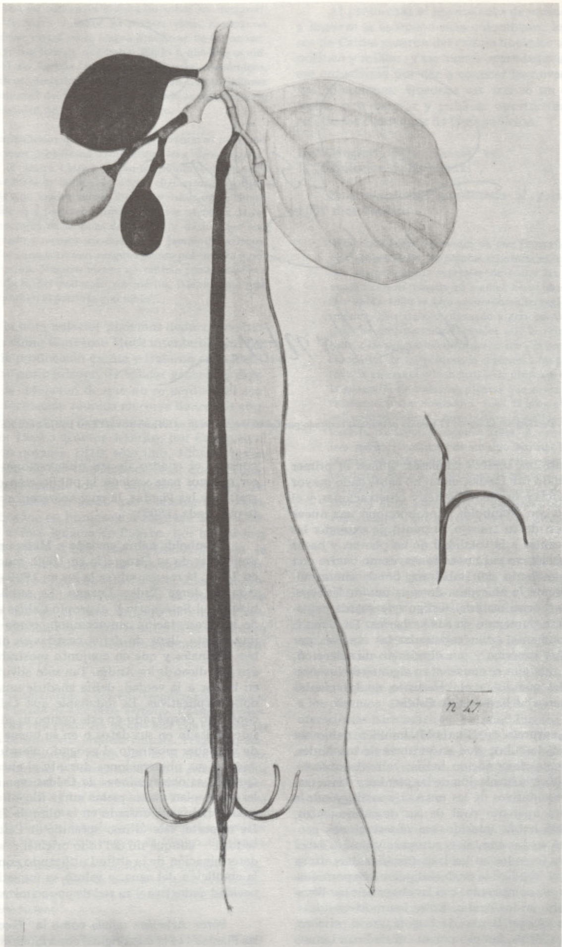
Figura 8. Lámina No. 47 del álbum de diseños de plantas elaborado por Caldas y correspondiente a Aethanthus dichotomus . El Original iluminado en colores se conserva en los archivos del Real Jardín Botánico de Madrid.