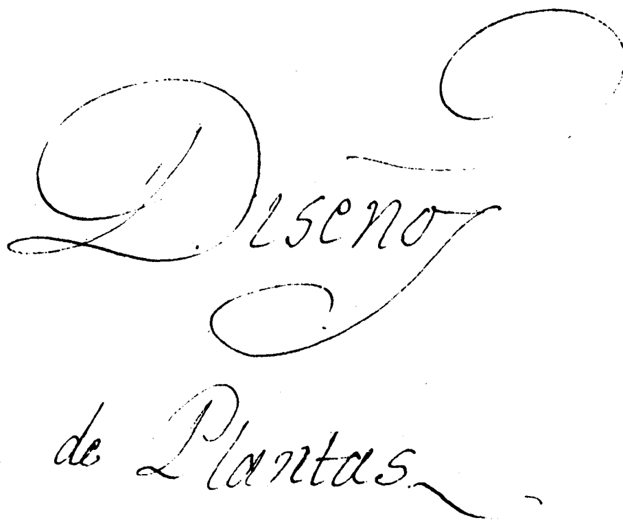
Figura 7. Carátula del álbum de 27 láminas policromas realizado por Caldas y conservado en los archivos del Real Jardín Botánico de Madrid.

na investigaba tópicos similares. Quizás el primer sorprendido fue Caldas, quien no había dado mayor importancia a sus deducciones y observaciones, y el contacto con Humboldt le proporcionó una nueva dimensión de su trabajo, al punto de extender las observaciones a la totalidad de las plantas y hacer más sistemáticas sus anotaciones, como ocurre con el levantamiento del Imbabura, donde anotó cuidadosamente la ubicación de cada una de las especies y herboriza material testigo que guarda cuidadosamente numerado en sus herbarios. En el mapa correspondiente están registradas las especies por su nombre genérico y por el número de colección, número que aún se conserva en algunos de los exsiccados del que fuera el "Herbario de las plantas ecuatorianas" o herbario de Caldas.