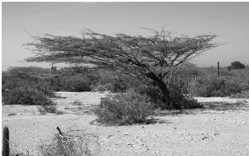
Figura 2. Comunidad de Castela erecta del parque eólico Jepirachi, en la cual se aprecia el “abanderamiento” de un ejemplar de Prosopis juliflora .

La comunidad estudiada en el área es de porte reducido (Figura 2) debido a las condiciones desfavorables del suelo, la escasez de agua y los vientos fuertes (EPM, 2002). La fisonomía se ve influenciada notoriamente por