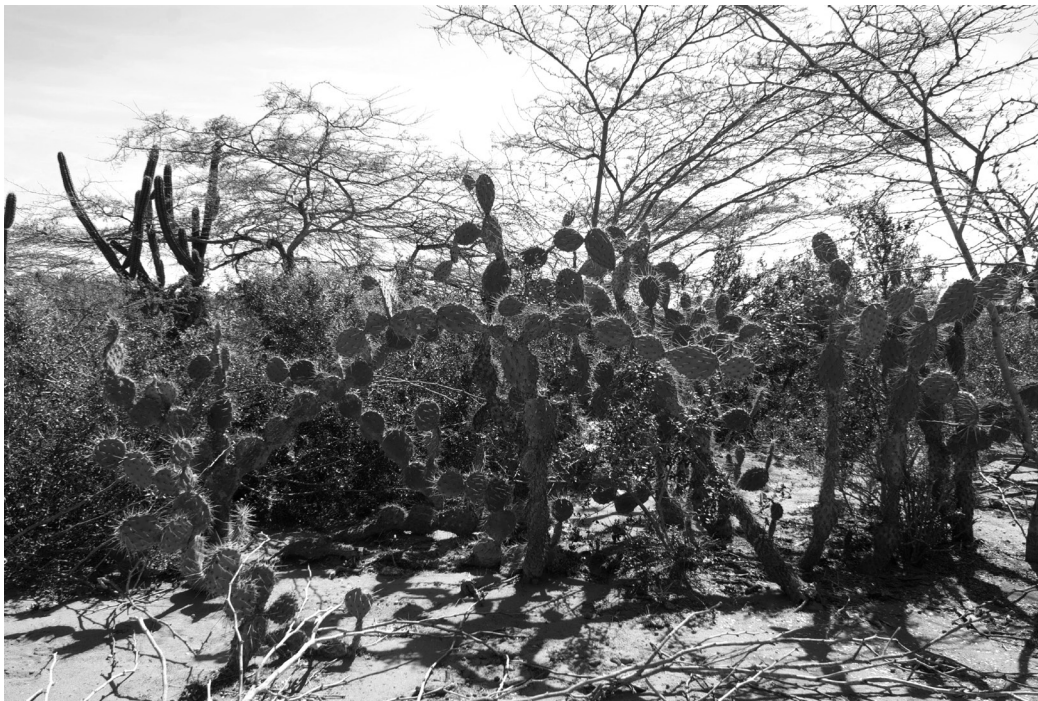
Figura 3. Efecto de “enfilamiento” en Opuntia caracasana . Nótese la ubicación de la mayoría de los cladodios de las tunas en un solo plano, en el cual los cantos se ubican contra el viento.

La fuerza del viento ejerce otro efecto importante sobre la fisonomía, el cual se manifiesta regularmente en O. caracasana , cuyos cladodios, o segmentos del tallo articulados unos con otros, se disponen de tal manera que sus filos o cantos se sitúan en contra del viento, reduciendo así el área de contacto y evitando la posible caída de la planta cuando el viento es muy fuerte. Para este efecto se propone la denominación de “enfilamiento”, el cual se puede observar en la figura 3, en la cual se observa cómo las plantas de O. caracasana tienden a estar en un solo plano.