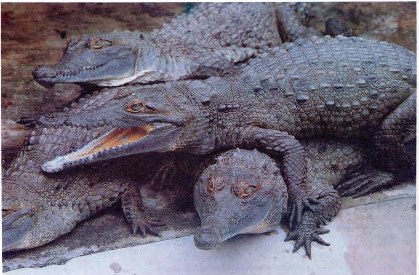
Figura 3. Crías de C. intermedius de 18 meses de edad.

(*) Estación de Biología Tropical "Roberto Franco".