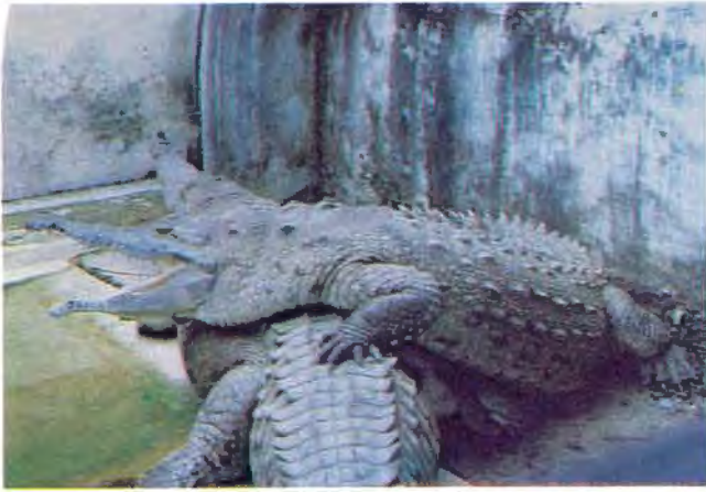
Figura 1. Pareja de reproductores de C. intermedius en la EBTRF.