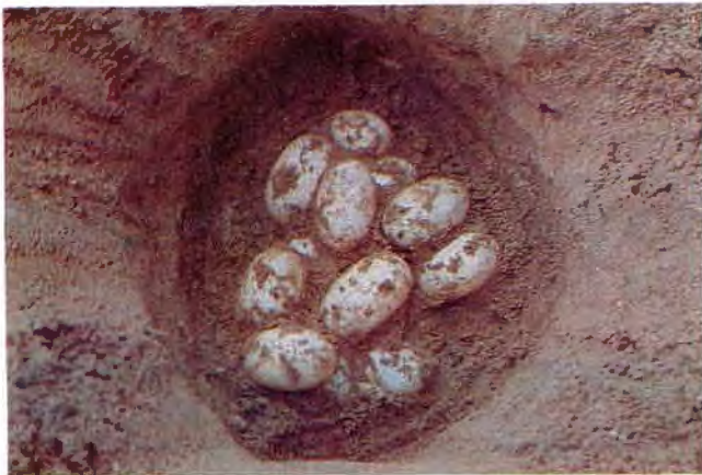
Figura 2. Nidada de C. intermedius en la EBTRF.