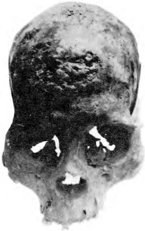
Figura 1. Cráneo de 0614 A-ICNMHN con caries Sicca muy visible.

ción de una exostosis. En los restos del húmero derecho se presentan también las cavidades redondeadas y erosiones.