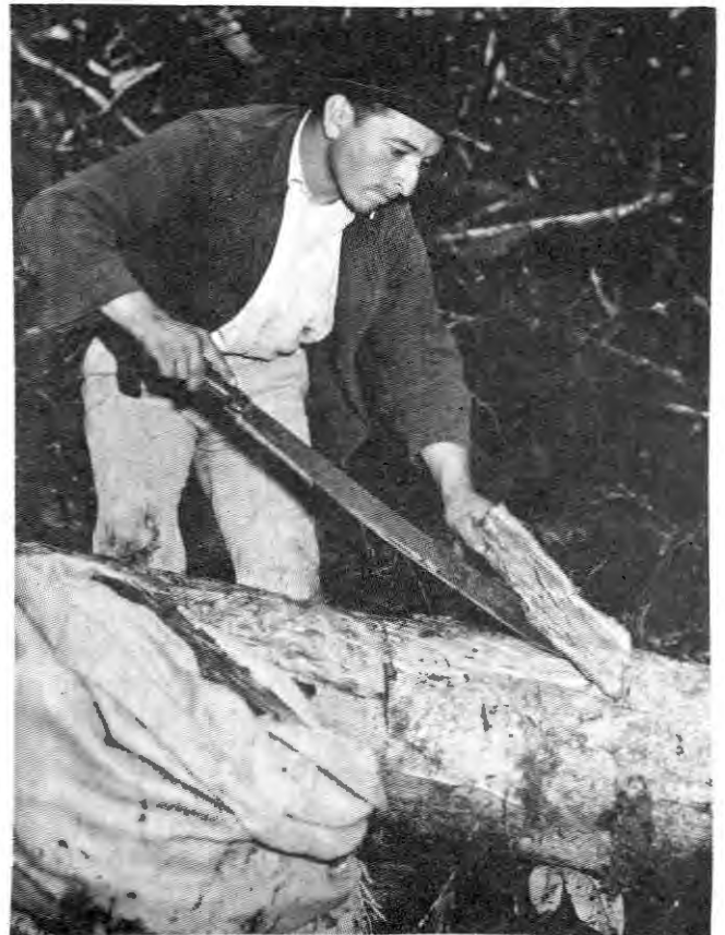
"Cascarillero" sacando con machete la Corteza del tronco tumbado de cascarilla en la selva de Chillanes a Bucay; la corteza "pelan" sólo de los troncos, desperdiciándose la de las ramas gruesas y delgadas.