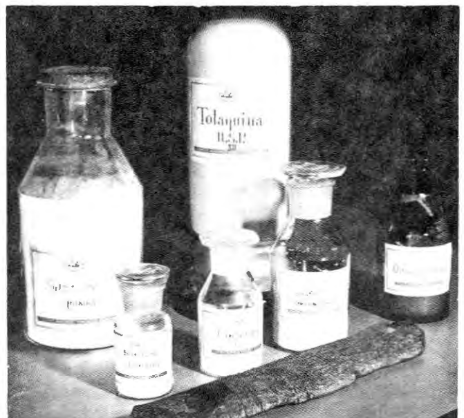
Productos obtenidos de la corteza de "cascajilla", (totaquina, sulfato de quinina, sulfato de cinchonina, cinchonina, sulfato de anconidina, quinintannic).

La agricultura de la Cinchona o la quinocultura en el Ecuador se ha practicado sólo en los valles tropicales occidentales de la provincia de Bolívar.