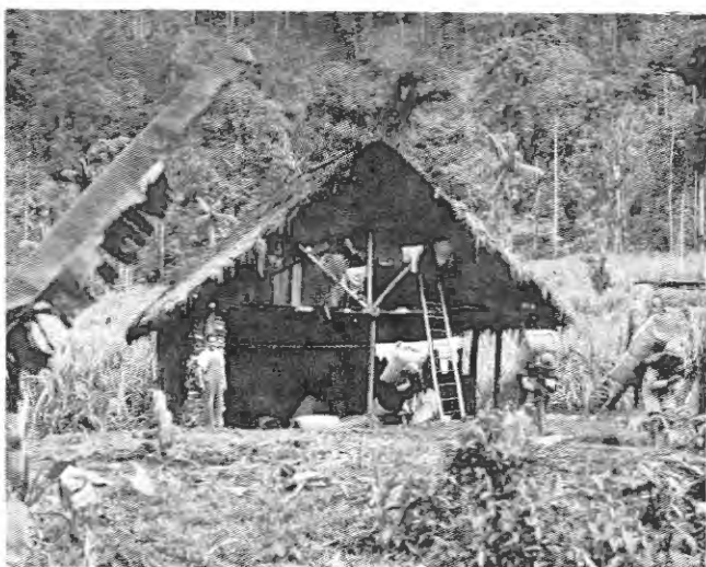
Campamento-secadero de "cascarilla colorada": Cinchona pubescens Vahl., al pie del bosque silvestre de explotación, en las faldas occidentales de la Cordillera Occidental, cerca de Maldonado, Prov. Carchi. La explotación se intensificó durante la Segunda Guerra Mundial.

ludismo y contra las diferentes fiebres malignas para la humanidad. El primer uso que se hizo de los polvos de la corteza de este maravilloso árbol, en persona blanca, fue en la Condesa de Chinchón (entre 1638 a 1639) con la cascarilla de Loja; más tarde; en 1640, se la llevó a España.