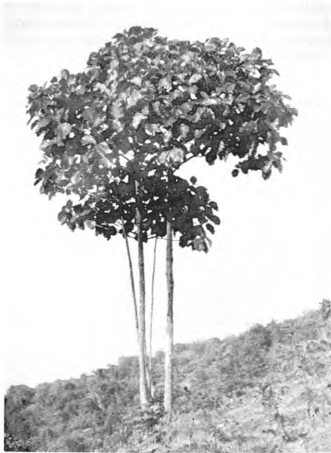
Arbolitos-retoños de la "cascaquilla roja": Cinchona pubescens Vahl., sin. C. succirubra R. et Pav. en la selva laderosa del descenso de la Cordillera Occidental de la Prov. de Bolívar, desde donde llevó plantas y semillas el naturalista Richard Spruce, a mediados del siglo pasado, para propagar en las Indias Orientales.

80. Porque la "cascaquilla" representa a uno de los árboles hermosos de los bosques subandinos tropicales y del país con su foliación rojiza en medio del verdor selvático, cuando madura. Existen otras importantes plantas y flores ecuatorianas que son dignas de representar al país, pero ninguna tiene la supremacía de la Cinchona o "cascaquilla".