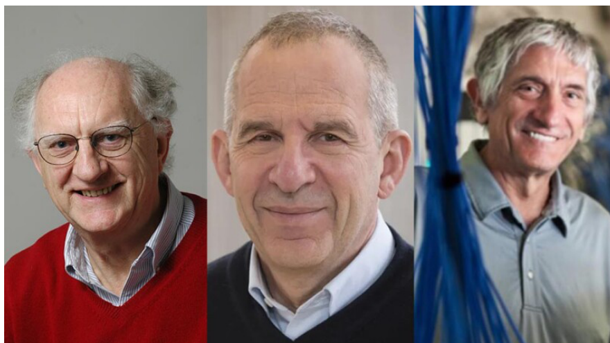
John Clarke, Michel H. Devoret y John M. Martinis.

Los galardonados tienen en común una trayectoria académica y científica similar. Clarke, nacido en 1942 en Cambridge, Reino Unido, obtuvo en el laboratorio de Cavendish de la Universidad de Cambridge su licenciatura en Física en 1964 y su doctorado en 1968,