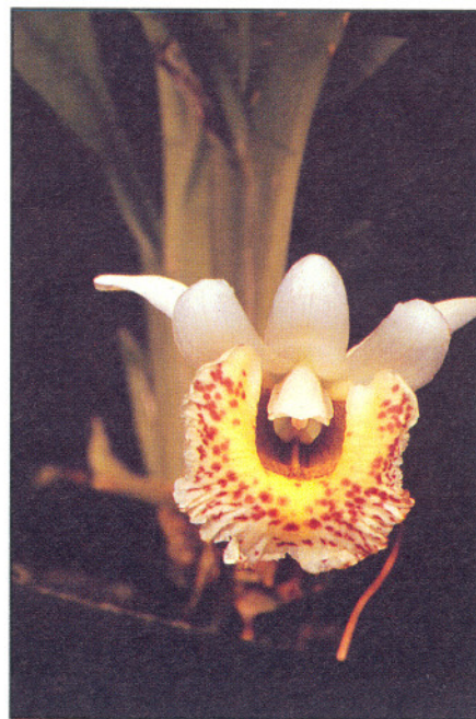
Figura 2. Chondrorhyncha manzurii P. Ortiz. Aspecto en vivo

largo, la lámina de hasta 38 cm de largo por 3.3 cm de ancho con ápice agudo. Inflorescencia oblicua, nacida de la parte interna de una vaina foliar, pedicelo con tres brácteas infundibuliformes de ca. 1.5 cm de largo. Flor única, con una segunda bráctea estéril, flor resupinada, relativamente grande para el género, sépalos y pétalos de color blanco, lámina del labelo amarilla con el borde anterior blanco con numerosas manchitas moradas. Sépalo dorsal elíptico agudo de 33 mm de largo por 10 mm de ancho, sépalos laterales elípticos agudos falcados de 37 mm de largo por 11 mm de ancho, fuertemente cóncavos, dirigidos hacia atrás y hacia arriba; pétalos elípticos obtusos de 30 mm de largo por 12 mm de ancho, con la base decurrente a lo largo del pie de la columna, con los ápices un poco reflexos; labelo anchamente elíptico, la lámina cóncava, de 36 mm de largo por 42 mm de ancho en el centro, los bordes laterales erguidos junto a la columna, el borde anterior reflexo, ondulado; callo ancho formado por una serie de quillas longitudinales que llegan hasta el medio de la lámina, las tres centrales más largas y destacadas de la lámina, formando una prominencia tridentada, la quilla central más alta que todas, con una prominencia mayor en la base, el callo tiene en total 20 mm de anchura. Columna algo curva, especialmente en la parte interna, algo ensanchada a los lados del estigma, de ca. 24 mm