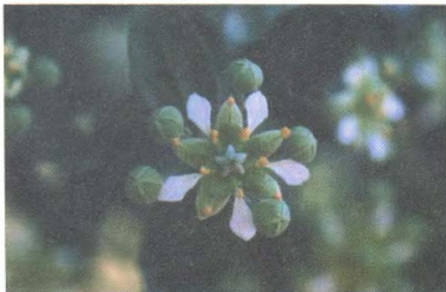
Figura 1. Detalle de la flor de Quillaja saponaria Mol. (Original de M.-T. Eyzaguirre)

El otro atributo tiene que ver con las sustancias presentes en la corteza que ha causado tanto revuelo médico como también ha puesto a la planta en las listas de plantas tóxicas. Quillaja saponaria está catalogada en Poisonous Plants of California (Fuller & McClintock 1986) debido a los glicósidos de saponinas tóxicas. Estas toxinas afectan típicamente a los animales de sangre fría pero si el tracto gastrointestinal de sangre caliente ha su-