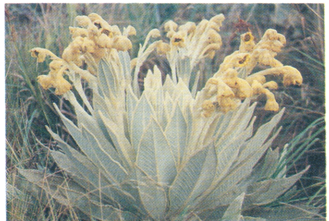
Figura 3. Espeletia marnixiana S. Díaz & Pedraza. Marnix L. Becking 1042 (Holotypus: COL [356212]).