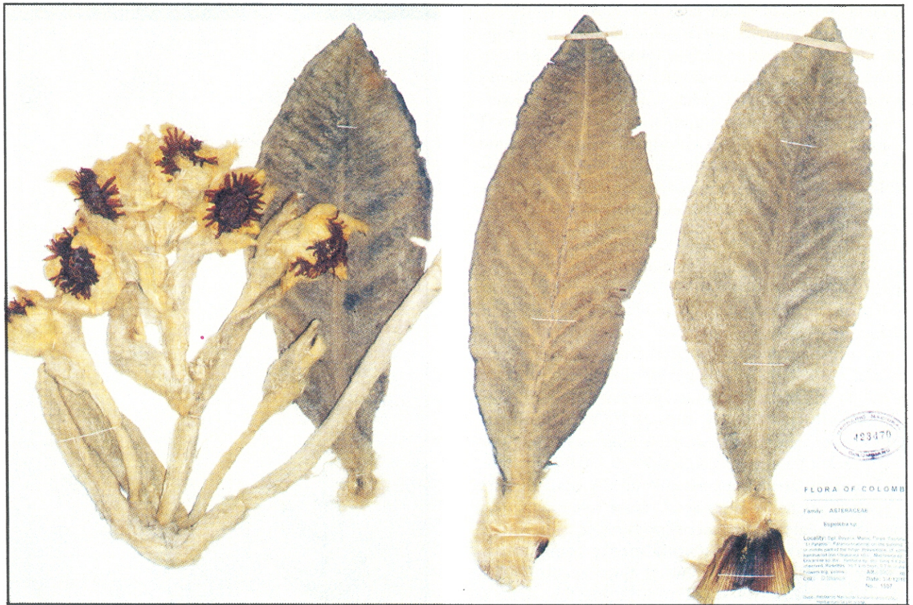
Figura 1. Espeletia paipana S. Díaz & Pedraza. Ejemplar típico, D. Stâncick 1507 (Holotypus COL [454570]); Isotipus: COL [423470], FMB).