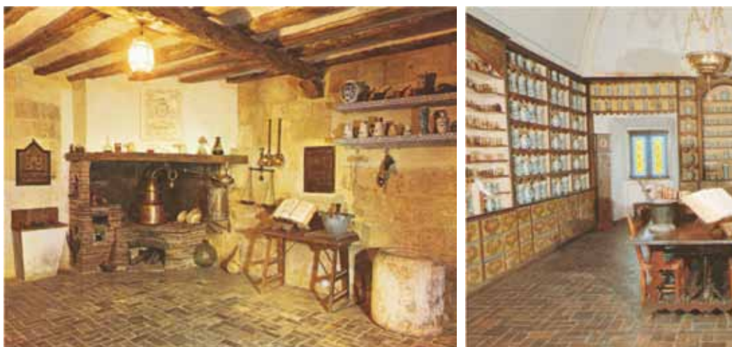
Figura 3. Dos aspectos del interior de una botica de la época.

época. El valor total de la de Santafé, descontado el costo de los muebles, tasados en seiscientos sesenta y seis pesos ($ 666), fue de mil cuatrocientos treinta y tres pesos ($ 1433) discriminados así: aguas: 60.6, aceites, 34.0, jarabes 78.4, pulpas, 21.0, confecciones 13.0, extractos 98.3, gomas y resinas 57.5, polvos 13.8, raíces 83.8, piedras 271.0, emplastos 153.2, píldoras 11.0, semillas 10.4, sales 36.4 y simples 490.8. A la luz de estas cifras la botica de Santafé no sólo estaba mejor surtida sino que tenía mayor valor y era digna de un convento, institución donde el potencial económico era superior al de cualquier boticario particular.