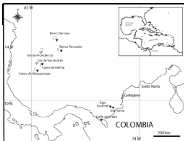
Figura 1. Ubicación de los arrecifes coralinos oceánicos y continentales colombianos en el Caribe sudoccidental. Los triángulos indican los sitios de muestreo.

Se establecieron en total 74 estaciones: 16 en los arrecifes continentales (Bushnell 2; Isla Fuerte 2; Urabá 12) y 58 en los oceánicos (Albuquerque 11; Courtown 14; Roncador 17; Serrana 16). Estas fueron distribuidas tratando de cubrir un amplio intervalo de zonas del arrecife coralino. Así, se ubicaron estaciones en bordes externos de terrazas prearrecifales, arrecifes periféricos de barlovento, parches lagunares y taludes, entre otros. En cada estación se evaluó la cobertura de los organismos sésiles mediante tomas en video sobre tres recorridos de cadena de 10 m de longitud (500 eslabones) dispuestos sobre el fondo, paralelos al contorno de profundidad y separados uno del otro por un par de metros (Sánchez, 1995). La cobertura de corales escleractíneos se determinó a nivel de especie, la de algas en lo posible a nivel de género o de grupos morfo-funcionales (v.gr. costrosas, céspedes y fron-