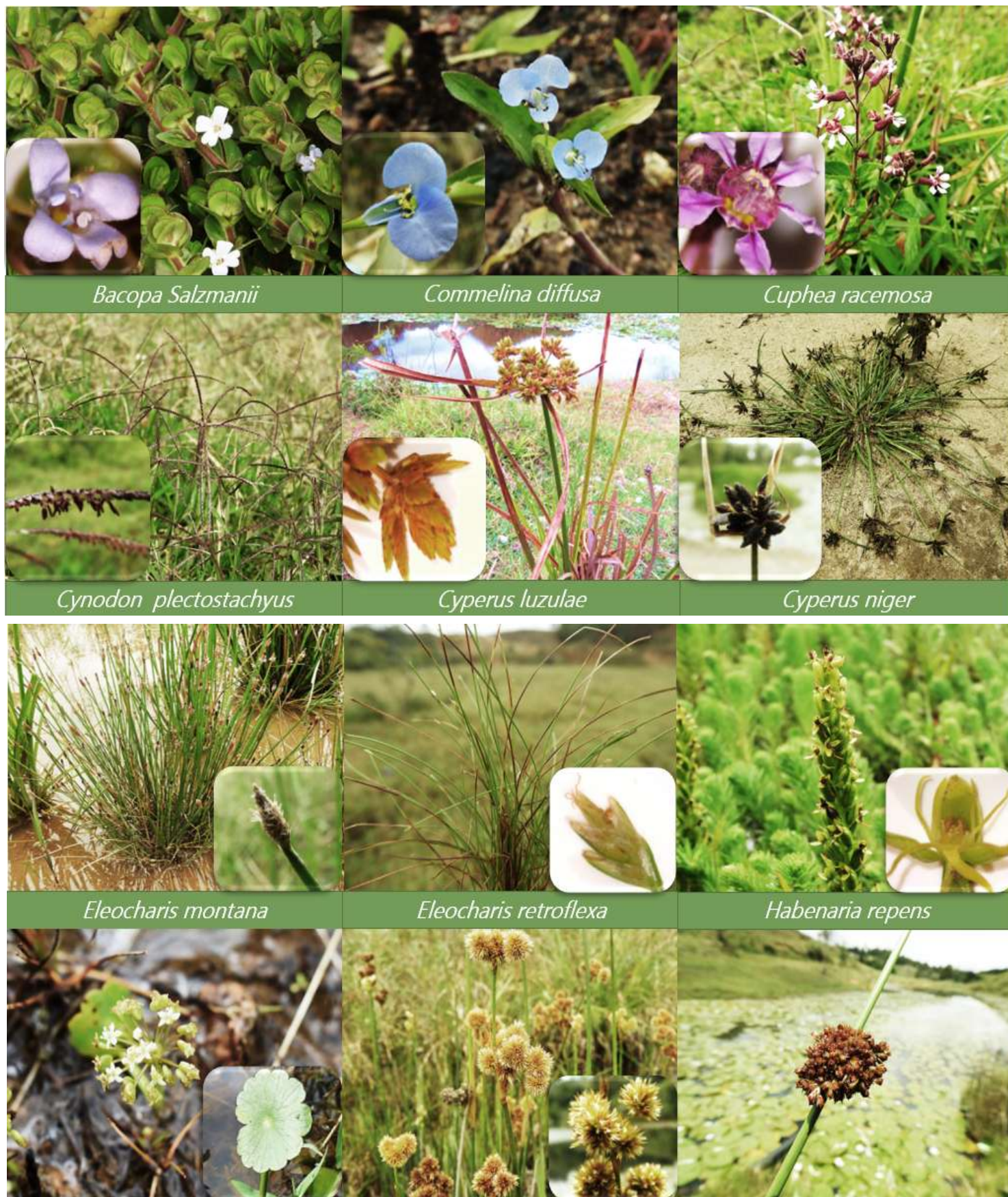
Figura 2S. Especies de plantas acuáticas más representativas de los humedales del Altiplano del Oriente Antioqueño